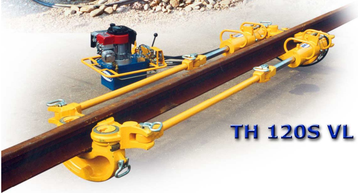
TH 120S VL