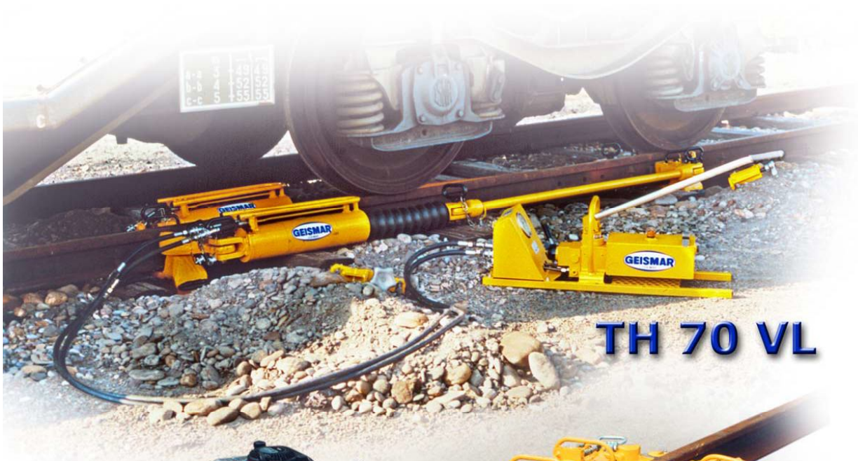
TH 70 VL