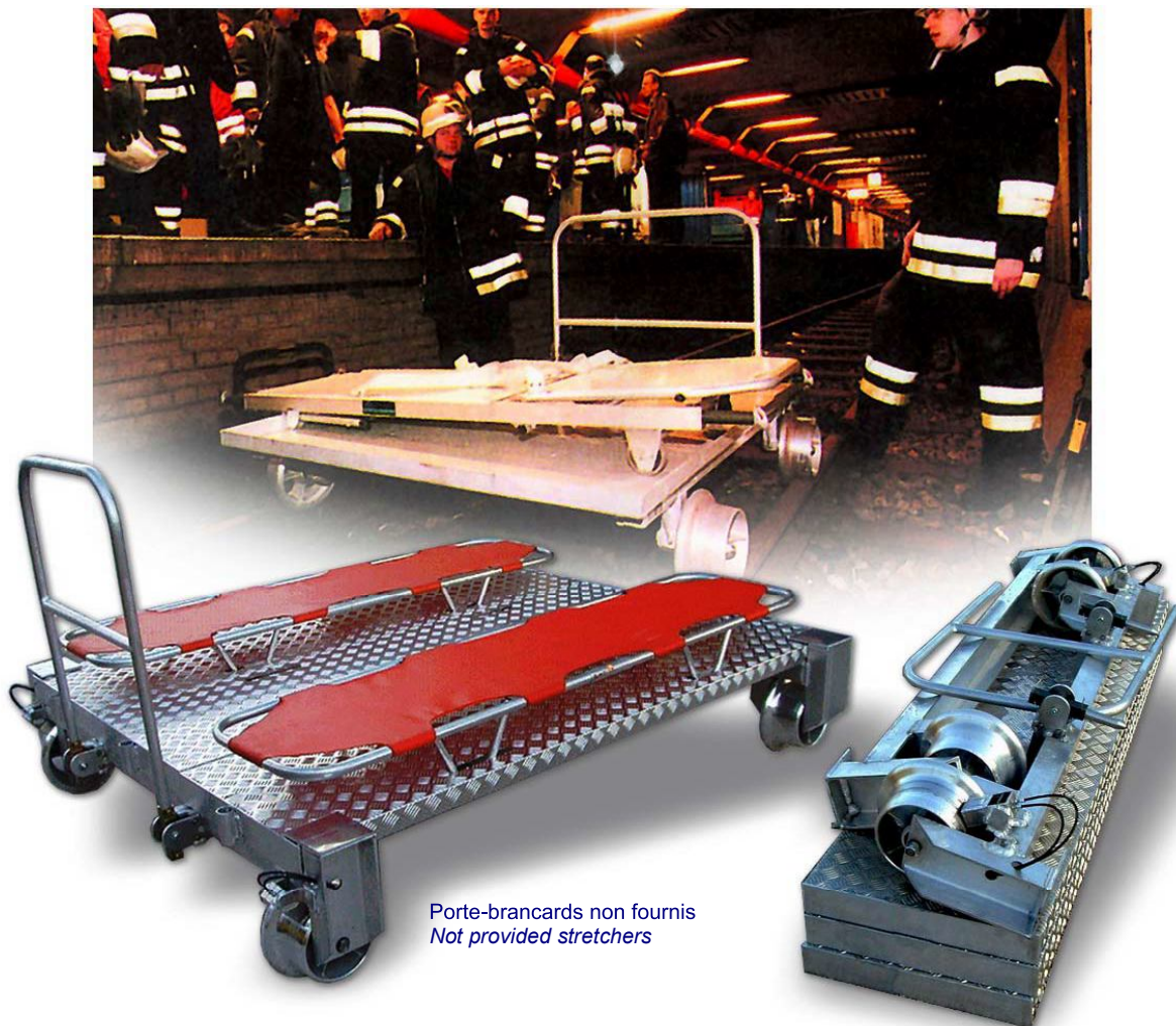
Porte-brancards non fournis Not provided stretchers